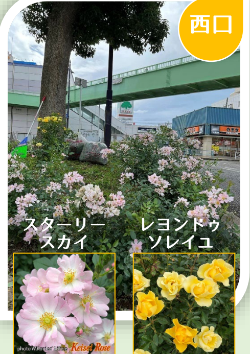
スターリー スカイ