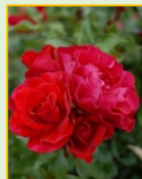
スーリール ドゥ モナリザ