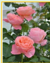
マドモアゼル メイアン