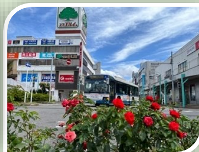
スカーレットポニカ